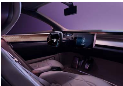
Quadro comandi digitale e in vetro con cruscotto e volante che sembrano fluttuare nello spazio davanti al conducente.

Un cruscotto simile a quelli attualmente disponibili sul mercato non è