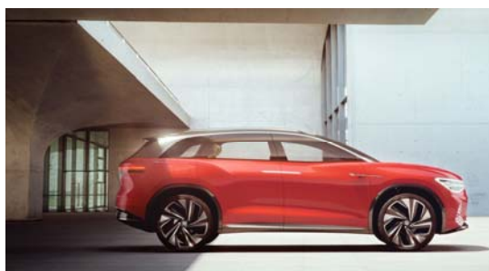
L'ID. ROOMZZ propone il netto profilo omogeneo della famiglia ID.

Schinznach-Bad/Shanghai: Volkswagen amplia la gamma della famiglia ID. elettrica con un modello tuttofare multivariabile: il nuovo ID. ROOMZZ. Un SUV a emissioni zero della classe lunga cinque metri. Dopo la ID. CROZZ, più compatta, Volkswagen presenta già il secondo studio di un SUV che lancia una generazione di veicoli elettrici completamente nuova. La versione di serie della ID. ROOMZ, adatta non solo alle famiglie ma anche alle imprese, sarà disponibile sul mercato a partire dal 2021. Volkswagen presenta lo studio in anteprima mondiale in occasione di Auto Shanghai, il salone dell'automobile di Shanghai, un omaggio alla Cina, oggi il principale mercato dei veicoli a emissioni zero. Con il SUV Volkswagen aumenta il ritmo della sua offensiva sul fronte dell'elettromobilità, nel cui ambito darà spazio a una nuova gamma di veicoli elettrici progressivi con un'autonomia che non ha nulla da invidiare agli attuali motori a benzina: la famiglia ID. Come tutti i modelli ID., anche la nuova ID. ROOMZZ si basa sul sistema modulare di elettrificazione a elementi componibili (SME).