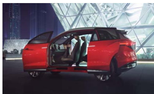
L'ID. ROOMZZ riserva una piacevole sorpresa con le nuove possibilità di personalizzazione e variabilità.

L'abitacolo riserva una piacevole sorpresa con le nuove possibilità di personalizzazione e variabilità, e grazie alle diverse regolazioni dei sedili